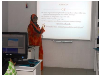
Caption : Bengkel ICT, Kelas E-Basic dan ILES serta taklimat E-waste