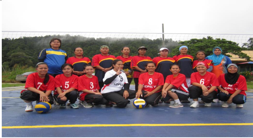
Caption : Ketika Hari Sukan Komuniti PI1M Kg Batu Putih 2016